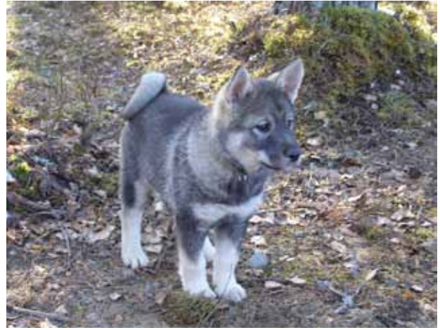
Karhunkeräjän joiku KVA hirvenhaukkukoe tulokset: 71,5p/77,5p/73,5/85p näyttely tulokset: ERI SA käyttövalio n.1,5 vuotiaan