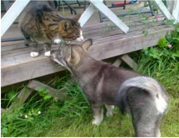
JPU Nestori FI35362/13 om. Miikka Puustinen / Pasi Kinnunen