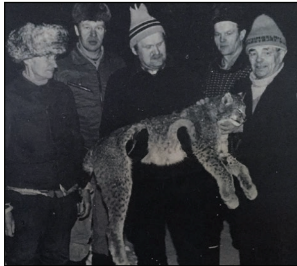
Kuva ei tiedettävästi liity tarinan tapahtumiin.